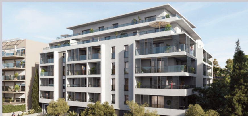
Lady Diana - Le Cannet (06) - 20 logements